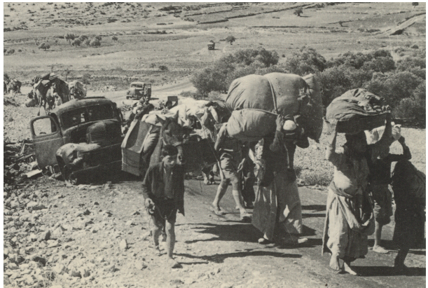
1948 fliehen arabische Palästinenser von Galiläa in den Libanon

1933, dass die Entrechtung der Juden im Nationalsozialismus einen Bekenntnisfall darstelle, weshalb die Kirche „dem Rad in die Speichen fallen“ müsse. Die Kampagne fragte: „Kann man Kirche und Christ sein und gleichzeitig zur Entrechtung des Palästinensischen Volkes und dem Missbrauch der Bibel zur Rechtfertigung des Landraubs schweigen?“ Kai-