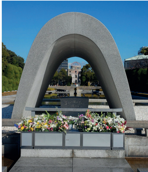
Le cenotaphe de la bombe A

Friedrich Engels. Sie hat auch mit ihm nicht aufgehört. Christoph Blumhardt, aber auch Karl Barth haben sich als „Religiöse Sozialisten“ verstanden, genauso wie die Theologie der Befreiung in Lateinamerika. Freilich auch ein Christentum, das sich vom Antikommunismus her definiert und nichts dabei findet, gleichzeitig fromm und geldgierig zu sein und ein „Wohlstandsevan-gelium“ zu verkündigen: Wenn du reich wirst, segnet dich Gott. So gesehen, ist Friedrich Engels keineswegs tot.