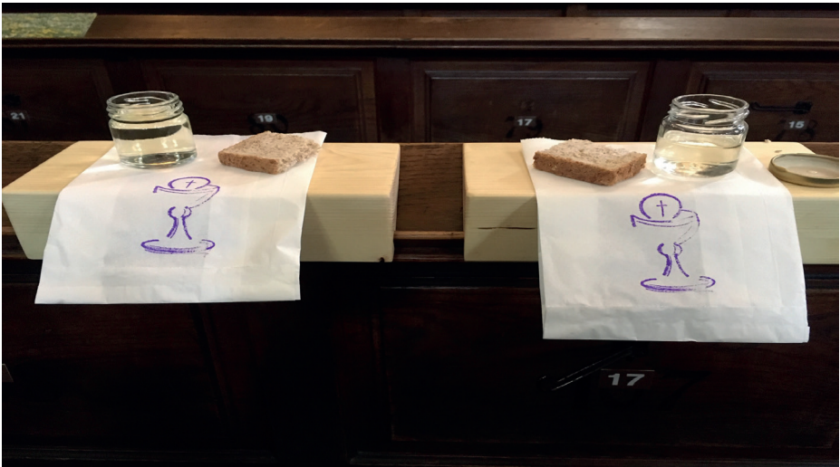
Corona-Abendmahl in St. Lukas München: Es muss trotz strikter Beachtung der Hygiene-Standards nicht ausfallen. Alle bleiben an ihrem Platz, Paare können beieinandersitzen, Einzelpersonen halten den gebotenen Abstand zueinander. Sanctus und Agnus Dei singt der Kantor.

Ich glaube, wir brauchen keine Krisen-Theologie. Ihre Alarmrufe werden sich abnutzen, wenn das Leben weitergeht. Denn es geht weiter, wie schon nach der Sintflut. Gott hat den Regenbogen über die Erde gesetzt, damit nicht aufhöre Saat und Ernte, Frost und Hitze. Nur der Prophet Jona hat sich gewünscht, dass die große Katastrophe